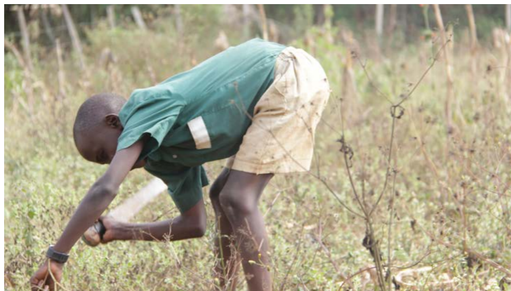
Kuvaaja: Lapsen oikeuksien ryhmä, Siaya, Kenia