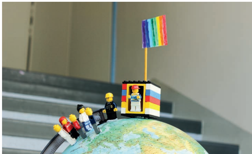
Kuvaaja: Anni Kananen, Kemijärvi

Lasten ottamia valokuvia Lapsuudelle arvo- projektissamme.