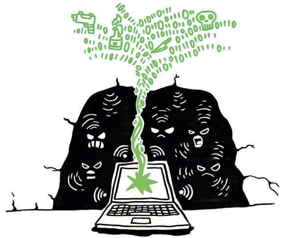
Netissä samanhenkiset ihmiset voivat saada vastakaikua ajatuksilleen ja verkostoitua. Kuva:Tussitaikurit Oy.

Nykykäsityksen mukaan verkko itsessään ei radikalisoi, mutta se luo lisää mahdollisuuksia radikalisoitua. Verkon kautta yhteydenpito muihin samanmielisiin on mahdollista vuorokaudenajasta ja maantieteellisestä sijainnista riippumatta. Siinä missä ennen sosiaalisten suhteiden luominen on rajoittunut maantieteellisesti lähiympäristöön, on verkon välityksellä mahdollista ohittaa maantieteelliset haasteet ja löytää samanmielisiä kontakteja laajemmin. Verkkoympäristössä tiedonjako pirstaloituu ja tietyn aihepiirin ympärille muodostuu omat yhteydenpitokanavansa, joihin samanmieliset ihmiset hakeutuvat. Kun tiedonjako keskittyy tietyille temaattisesti jakautuneille foorumeille, ei vastakkaisia näkökulmia tule vastaan yhtä helposti kuin reaali maailman sosiaalisissa kontakteissa. Näin myös esitetty viesti vaikuttaa vakuuttavammalta, kun vasta-argumentteja ei esitetä. Tutkijat puhuvatkin verkosta kaikukammiona, jossa yksilö saa vahvistusta omille (ääri)ajatuksilleen. Verkkoympäristö luo samanmielisyyden lisäksi helposti illuusion siitä, että samoin ajattelevien ryhmä on suurempi kuin se tosiasiasa on.